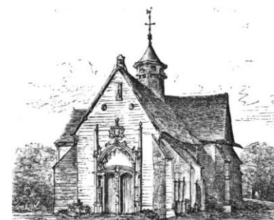
Dessin de Charles Fichot

Javernant est une petite commune située à 20 km au sud de Troyes.