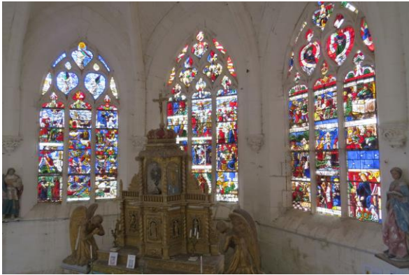
Les vitraux sont classés