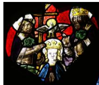
Notre-Dame de l'Assomption