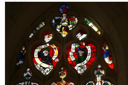
Dieu le Père