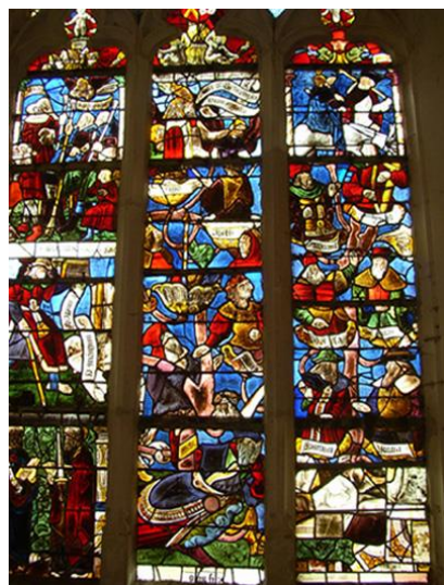
Arbre de Jessé