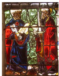
St Pierre & St Paul