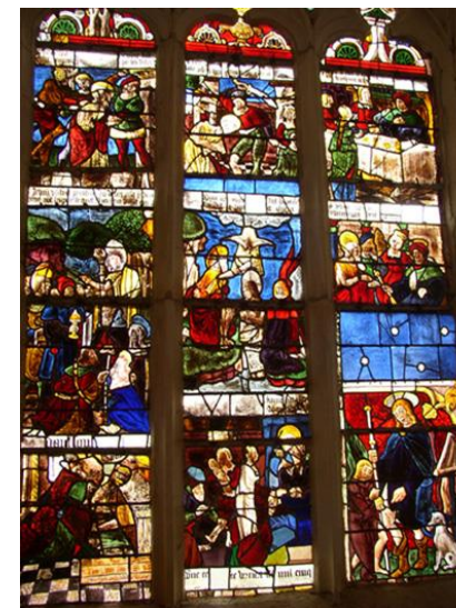
La vie de St Jean-Baptiste