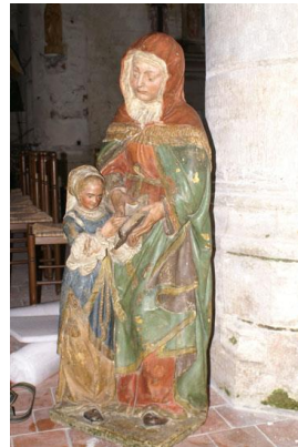
St Vorle Patron secondaire Bois XVIème Éducation de la Vierge Pierre XVIème Toutes deux classées