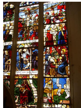
La vie de Jésus