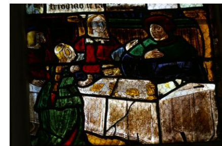
Le festin d'Hérode