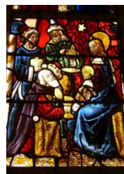
Les Rois mages